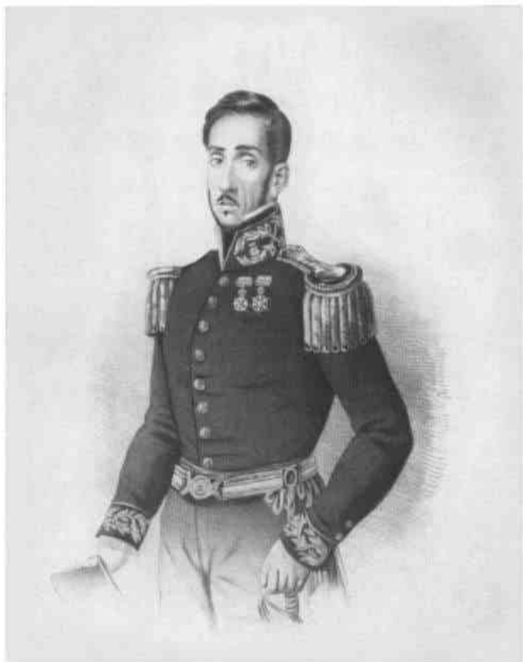
MIGUEL DE FUCA E VASCONCELOS