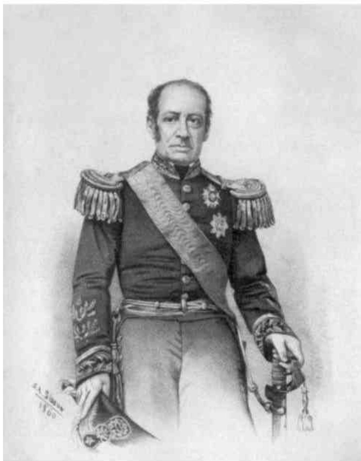
JOÃO MARCELINO DE SALES, VISconde de Albuquerque