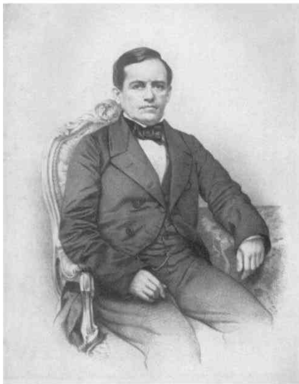
BARÃO DE MUMETIRA