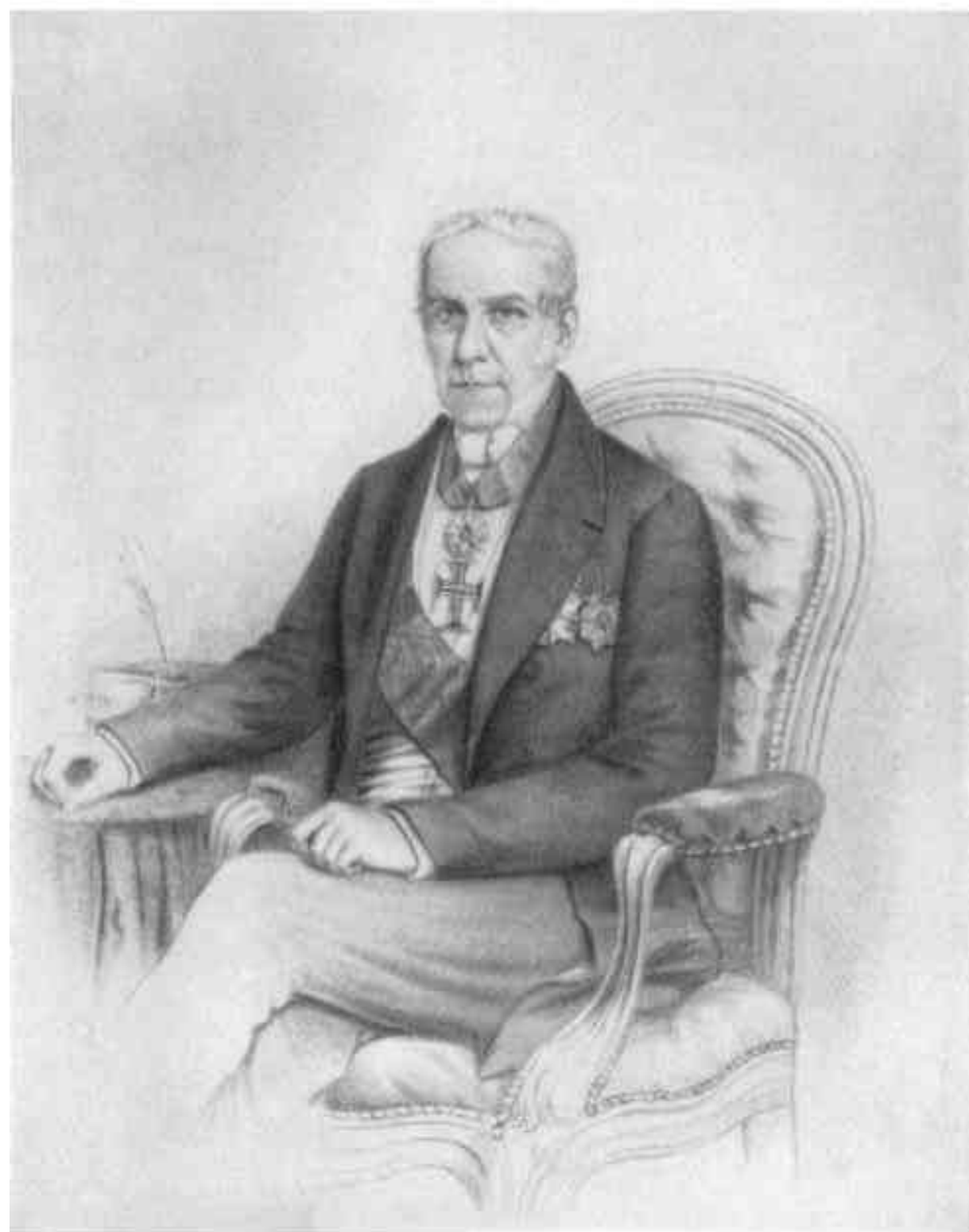
VISCONDE DE PEREIRA. BRASILEIRO.