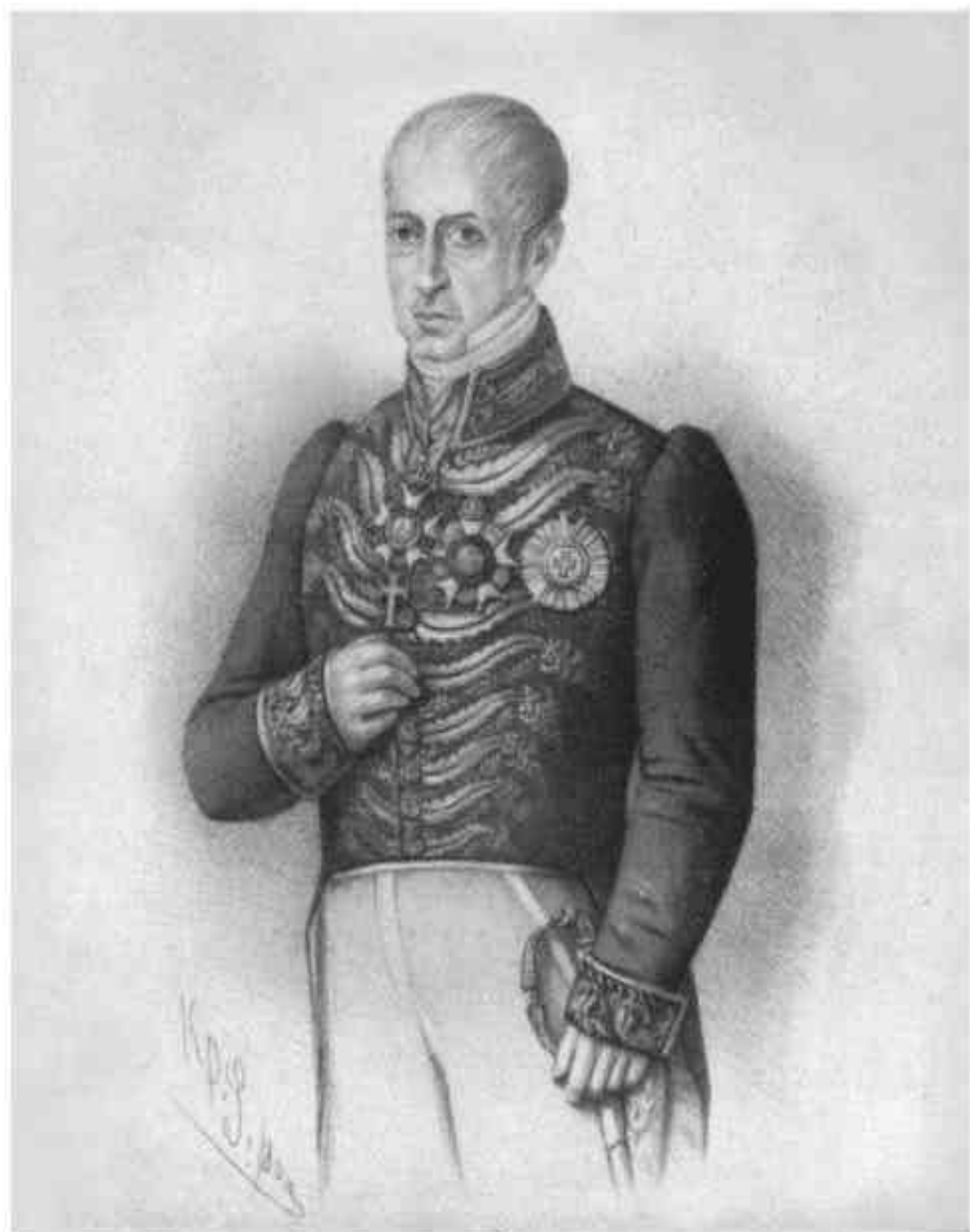
MARQUEZ DE ITURBIDE