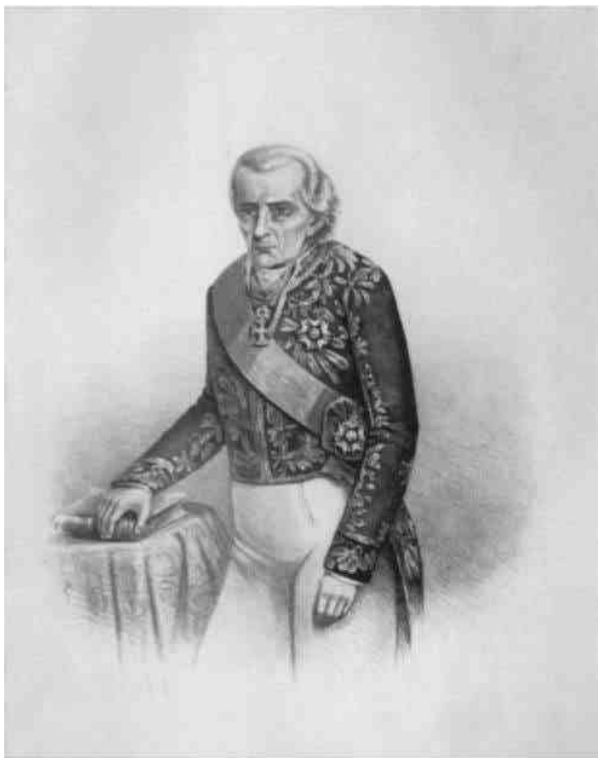
MARQUÊZ DE MARIÇÁ