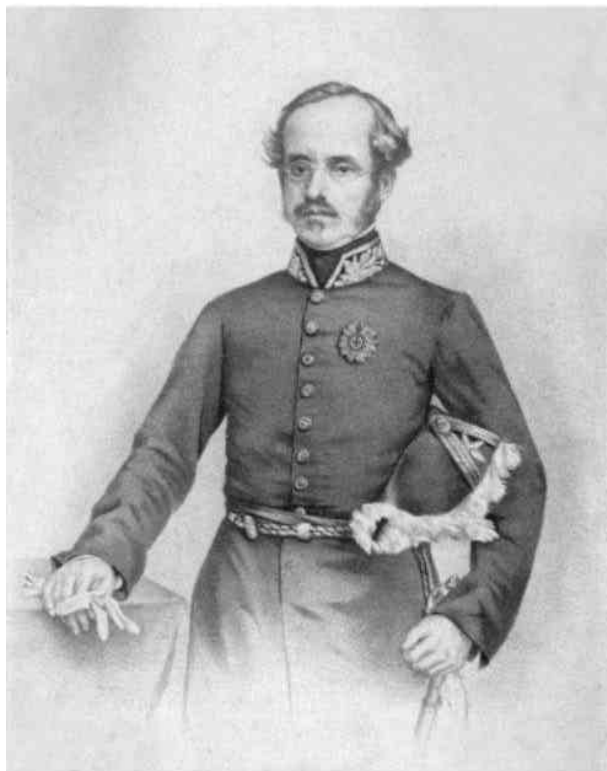
PEDRO II o ALCANTARA BELLEGARDE