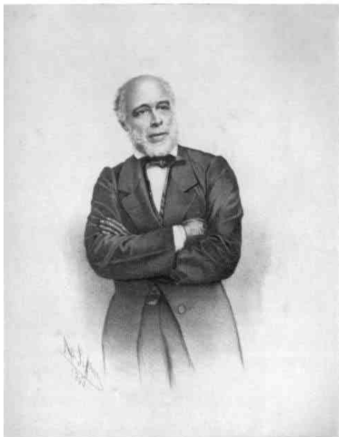
VISCONDE DE JAQUEIRA