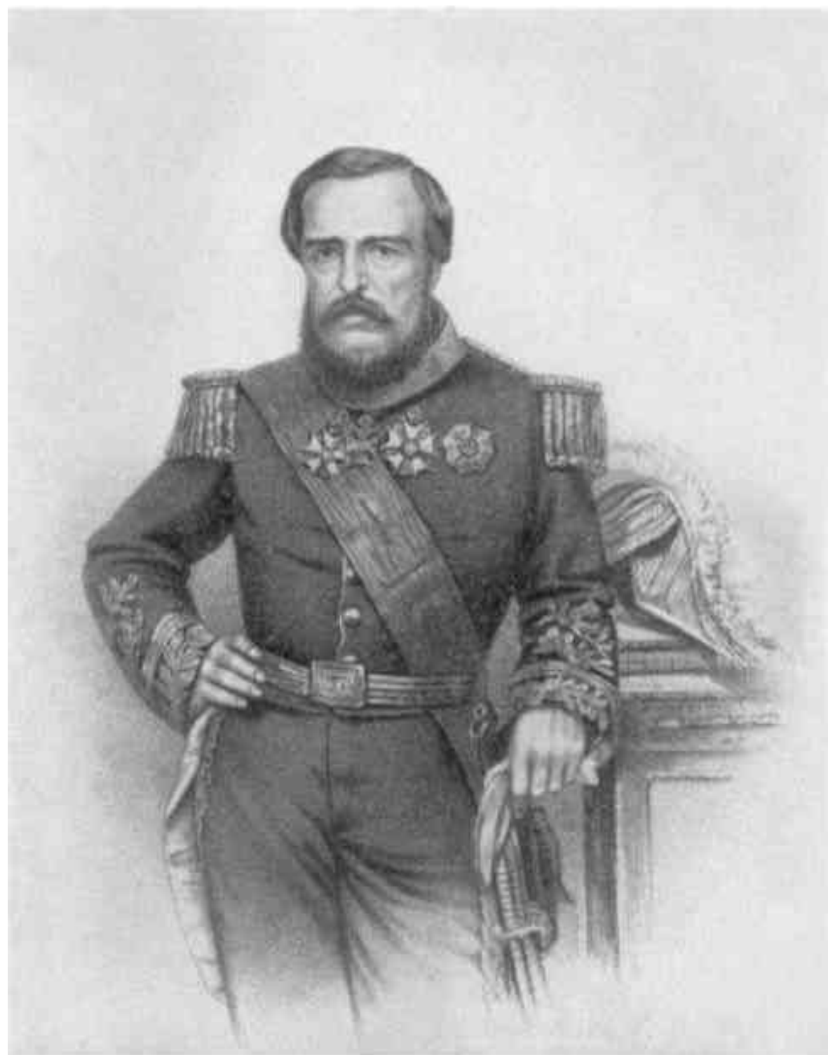
BAIÃO DA VICTORIA.