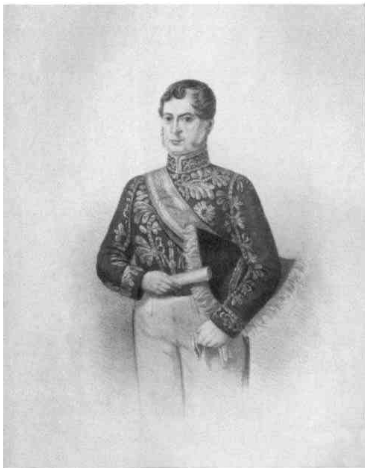
NEAQUITES DE S. JOÃO DA TRINHA