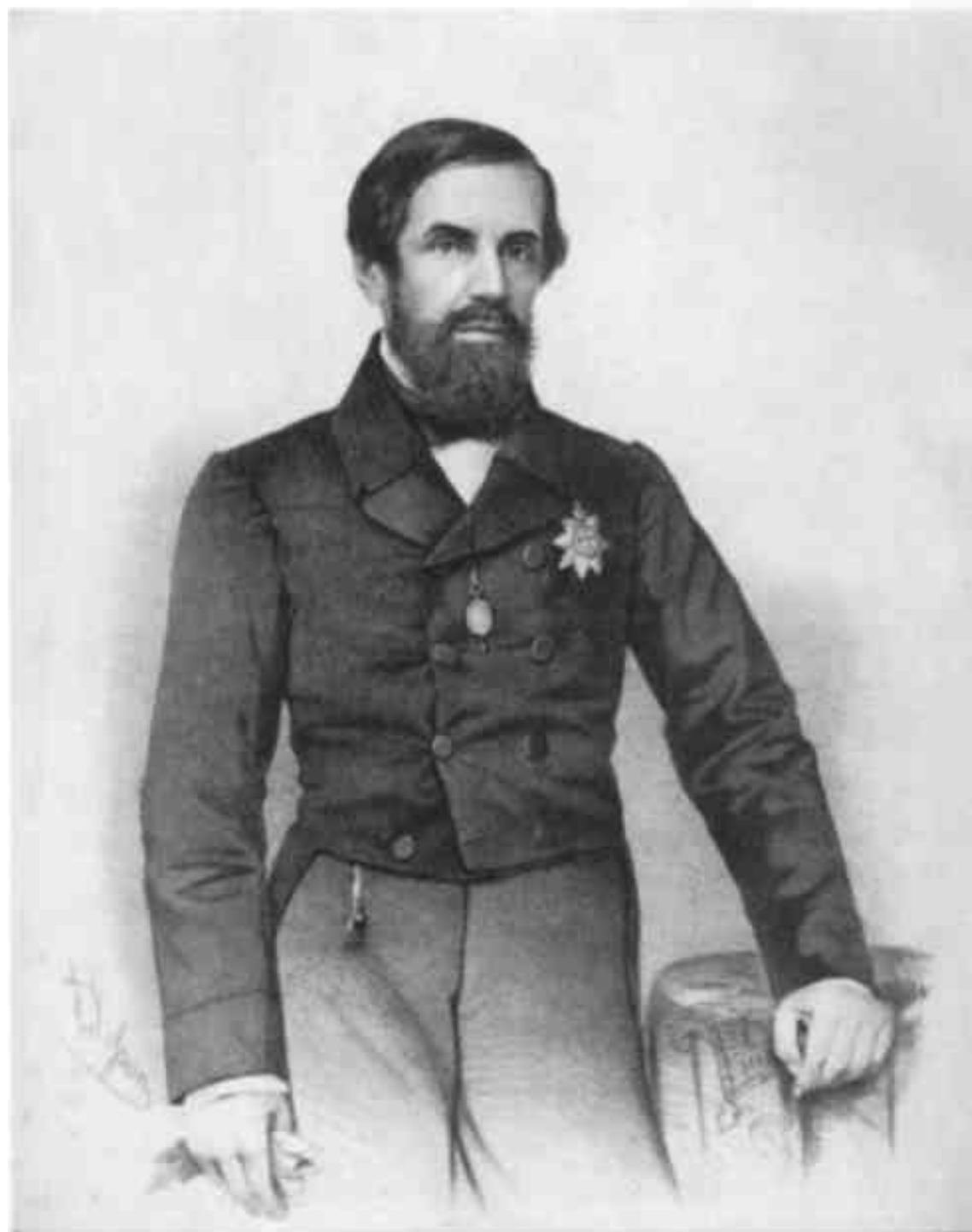
EXASATIÃO DE MESO BARROE