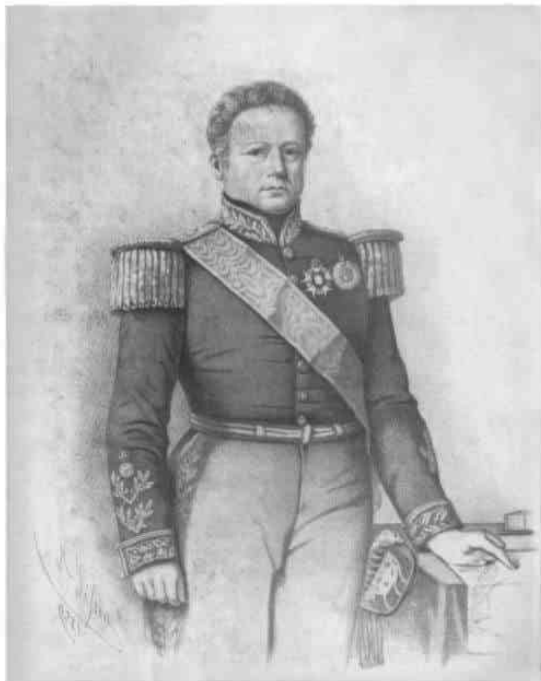
BARÃO DE CAÇAPAVA