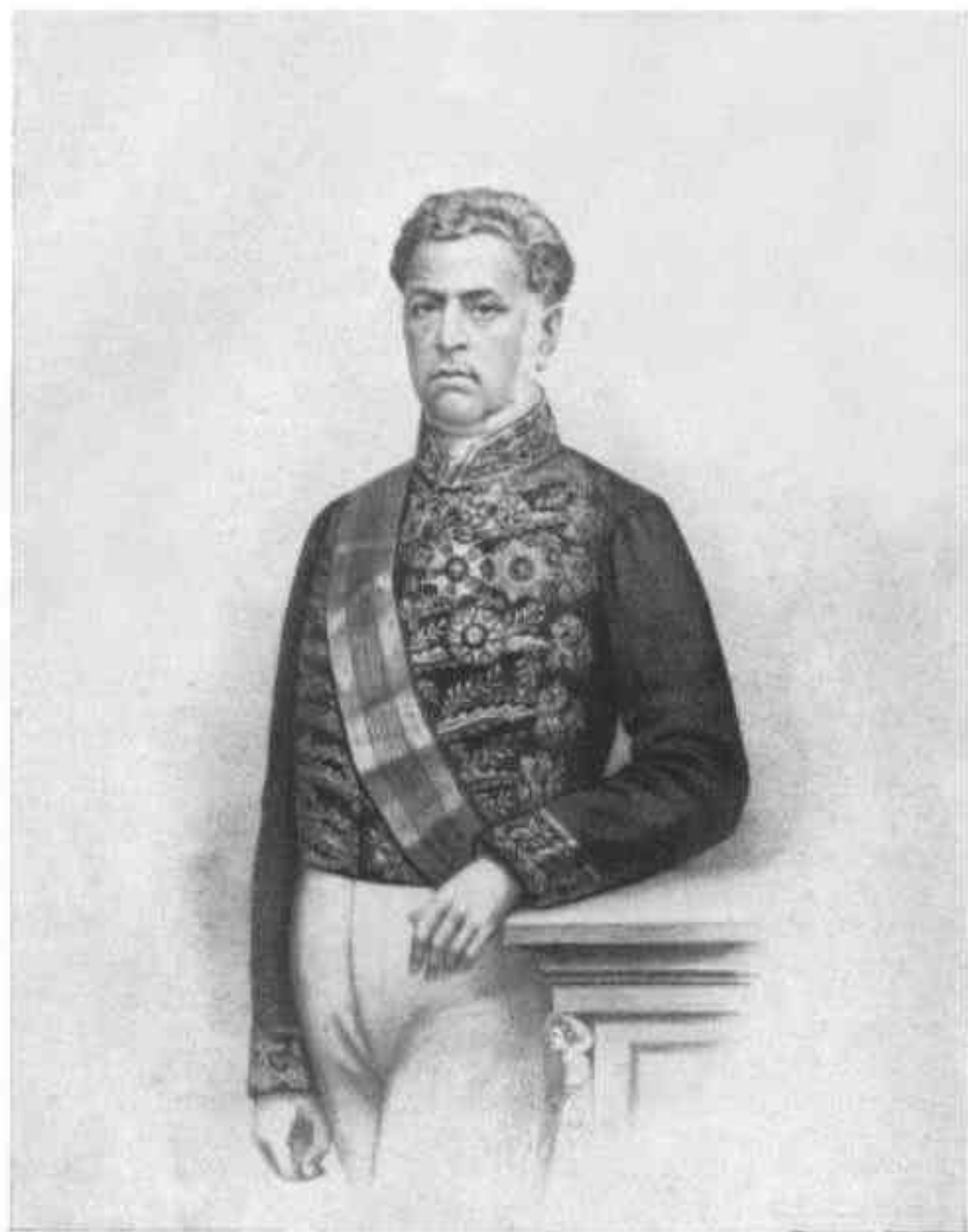
VISCONDE DE SPETHIA