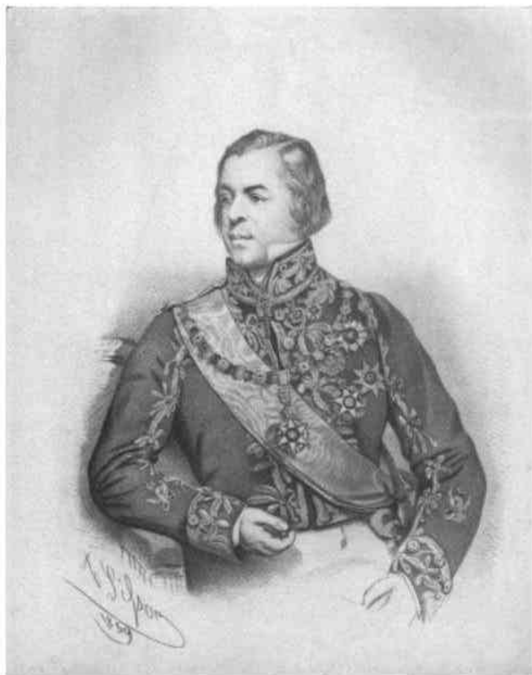
MAIQUKZ DE BARRACENA.